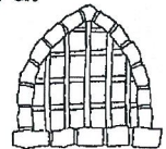
La familia del Carcelero de Filipo