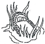
La familia de Moises

Circula la historia Bíblica de la familia que se asemeja más a la tuya.