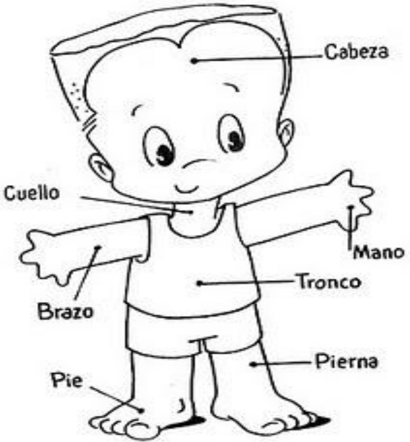
Partes del cuerpo